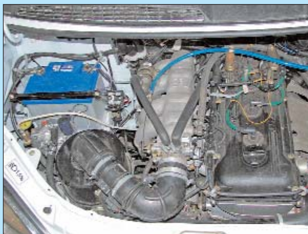
Внешний вид моторного отсека автомобиля ГАЗель с установленным газобаллонным оборудованием.

Двигатель запускается на бензине, а переключение на газ происходит только после перегазовки. После переключения на газ, двигатель на холостом ходу работал нормально. При плавном открытии дроссельной заслонки, сначала обороты двигателя возросли, но после дальнейшего открытия дроссельной заслонки двигатель начал "душиться". При резком открытии дроссель-