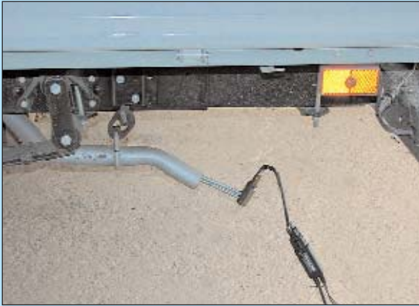
Установка широкополосного лямбда-зонда в выхлопную трубу автомобиля для проведения измерений состава топливоздушной смеси.