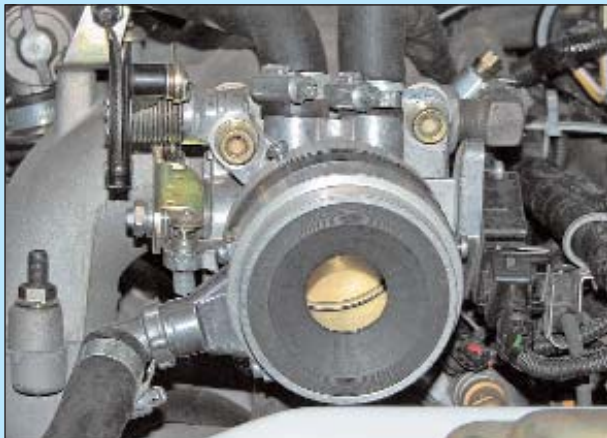
В корпус смесителя установлена дополнительная вставка, уменьшающая площадь проходного сечения для воздушного потока.