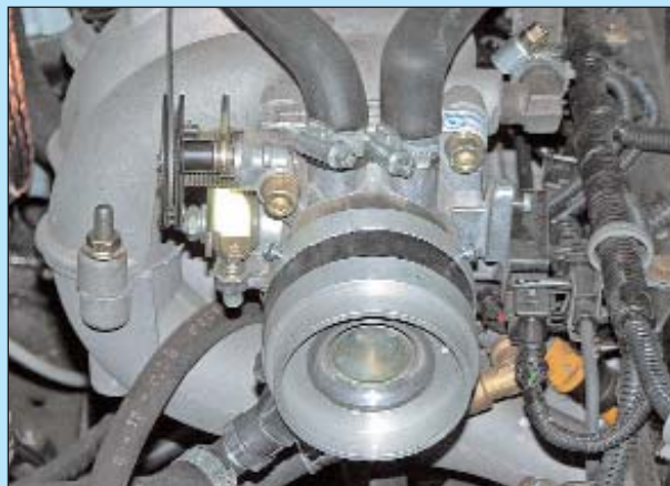
К корпусу дроссельной заслонки прикреплен "универсальный смеситель", предназначенный для установки на двигатели автомобилей "ГАЗель".

слишком малое разрежение, либо недостаточна номинальная мощность газового редуктора. Но, к корпусу дроссельной заслонки был прикреплен "универсальный смеситель", предназначенный для установки на данное семейство двигателей.