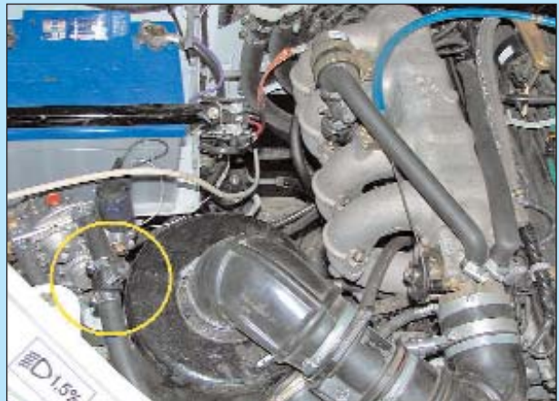
Расположения "дозатора", предназначенного для регулировки состава газовой смеси под нагрузкой.

ной заслонки, двигатель вообще отказывался развить обороты, но при этом не глох.